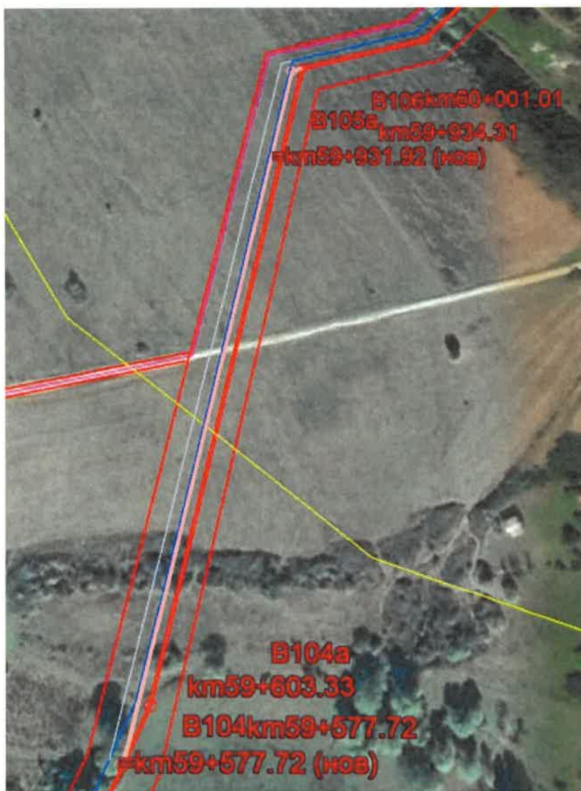
Фигура 6 Визуализация на изменение по буква "в-6" за спазване на отстояния от въздушен ел. провод върху подложка от Google Earth

в-7) Изменение на трасето на газопровода и оптичния кабел от км 60+963.25 до км 61+000.27 = км 61+000.99 (нов)