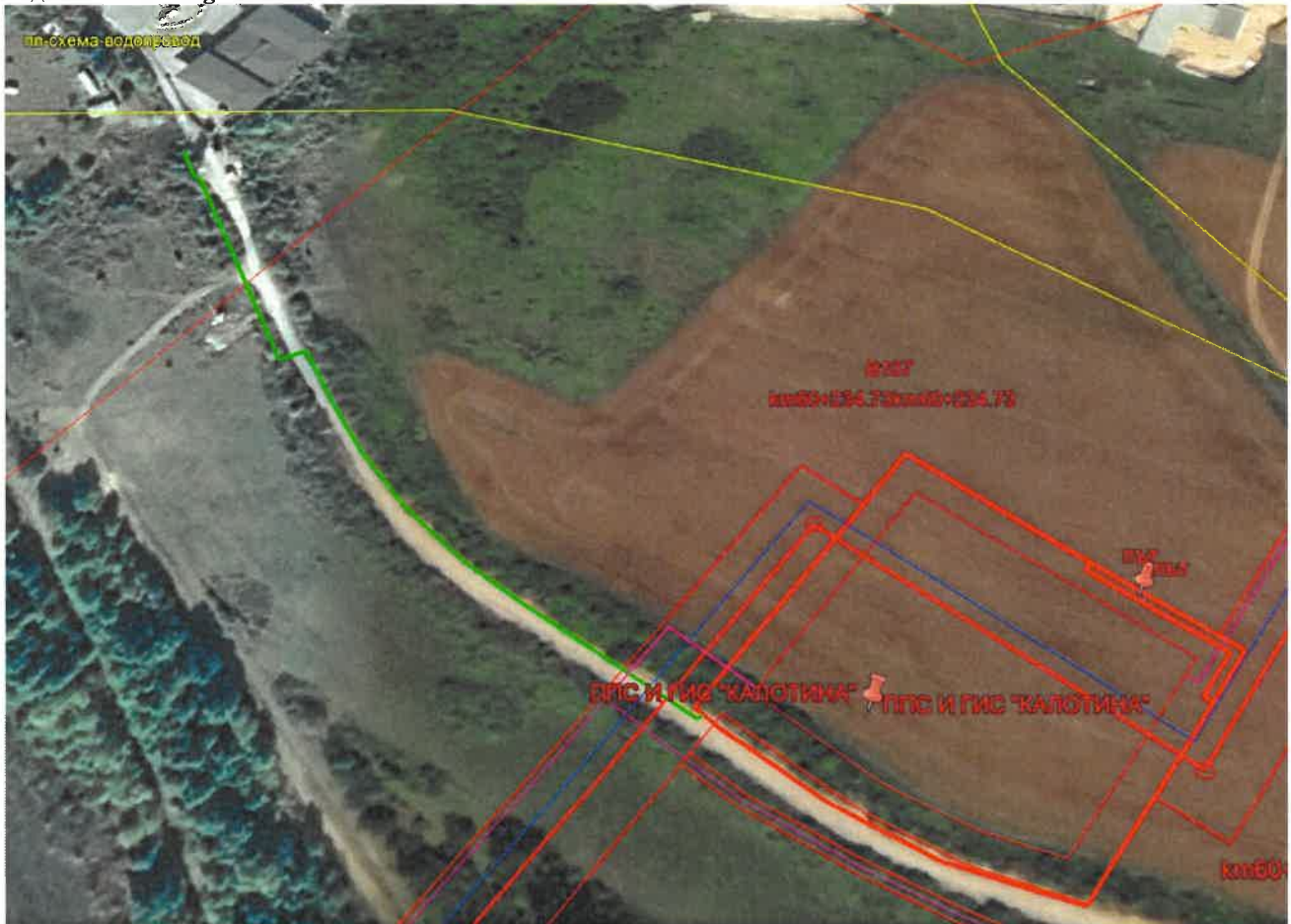
Фигура 8 Визуализация на изменение по буква "в-8" за обслужващ водопровод до ГИС Калотина върху подложка от Google Earth