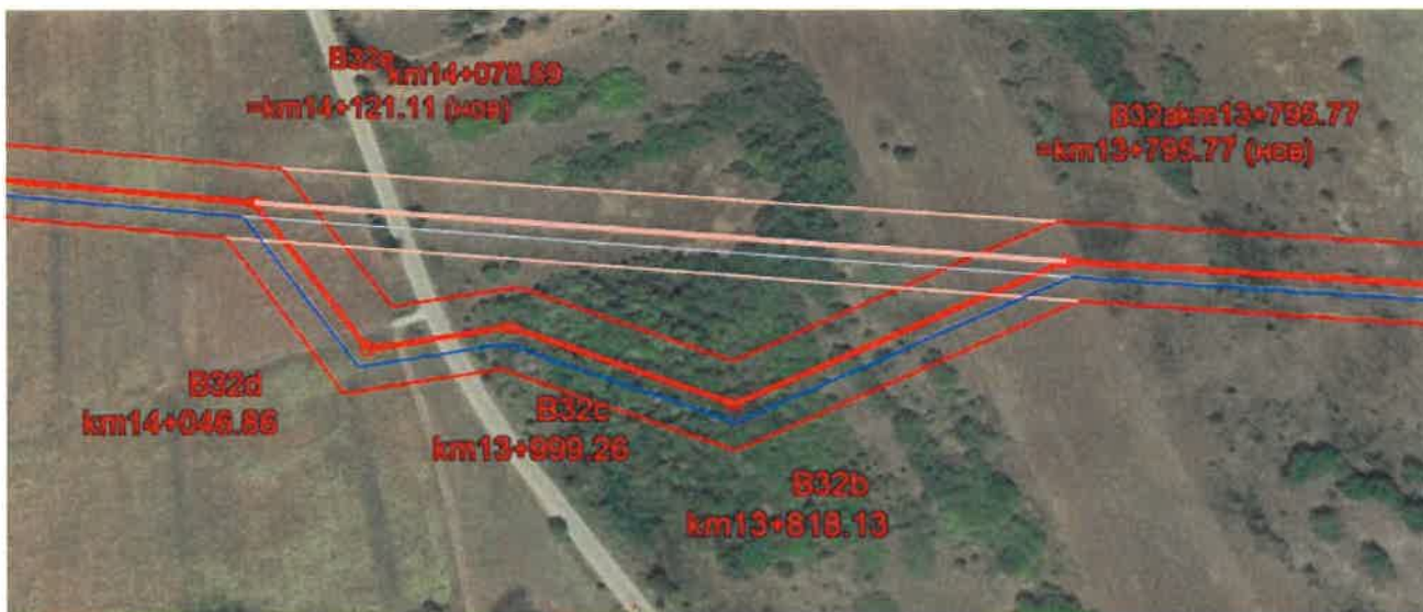
Фигура 2 Визуализация на изменение по буква "в-2" южно от археологически обект № 4 върху подложка от Google Earth