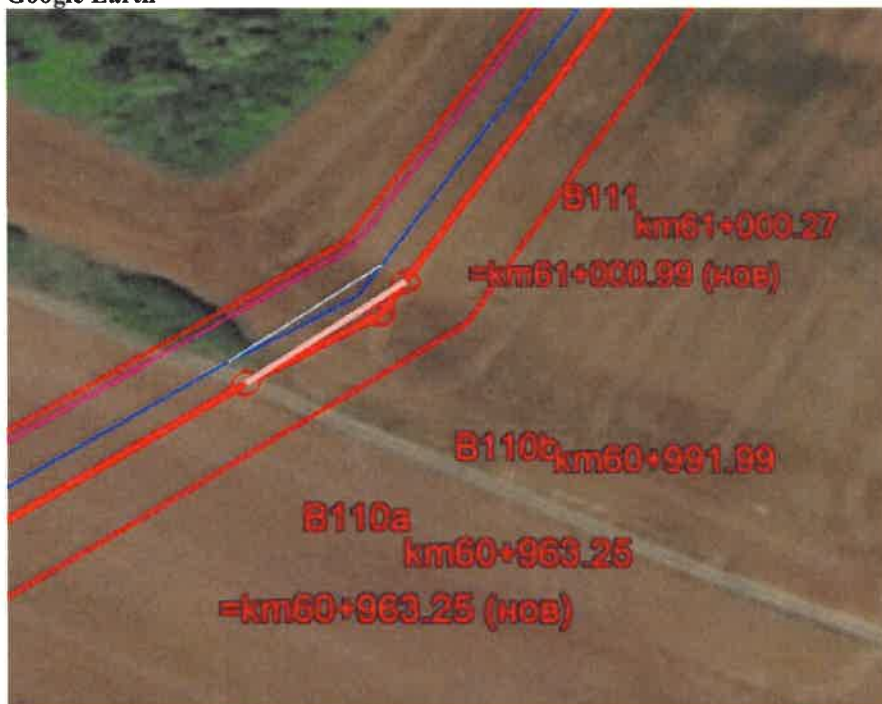
Фигура 7 Визуализация на изменение по буква "в-7" поради проект на нова жп линия върху подложка от Google Earth

в-8) Разрешение от „В и К“ ЕООД гр. София за изграждане на външен водопровод за обслужване на битови и социални помещения към административна сграда на площадката на ГИС „Калотина“, е получено след одобряване на ПУП- ПП окончателен проект. Това налага за трасето на външния водопровод до площадката на ГИС „Калотина“ да се разработи Парцеларен план за участъка от трасето попадащ извън урбанизирана територия и план-схема за участъка попадащ в урбанизирана територия. Получени са изходни данни за проектиране на сградно водопроводно отклонение и условия за присъединяване към водопроводната мрежа на „ВиК“ ЕООД – София с писмо изх. № ТО-01-571/18.09.2020г. Начална точка на новопроектираното отклонение е съществуващия хранителен (захранващ) водопровод ф2”, като трасето се движи само в урбанизирана територия и в границите на местен път. Приблизителната дължина на водопроводното отклонение е около 300м.