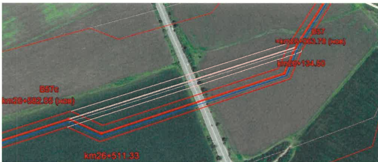
Фигура 3 Визуализация на изменение по буква "в-3" във връзка с проект на площадка за отдих при републикански път върху подложка от Google Earth

Изменението се налага заради заобикаляне на площадка за отдих по проект за модернизация на път I-8 от Републиканската пътна мрежа в землището на с. Храбърско в община Божурище, Софийска област. Съгласно изискванията на нормативната уредба газопроводите трябва да имат необходимото отстояние от подобни съоръжения. Трасето на газопровода е изместено на около 50 m на изток, за да се спази минималното отстояние от 100 m за газопровод клас 3. Проектирани са нов оптичен кабел, успоредно на трасето, нов симетричен сервитут (2x15m спрямо оста) и нова зона за превантивна устройствена защита.