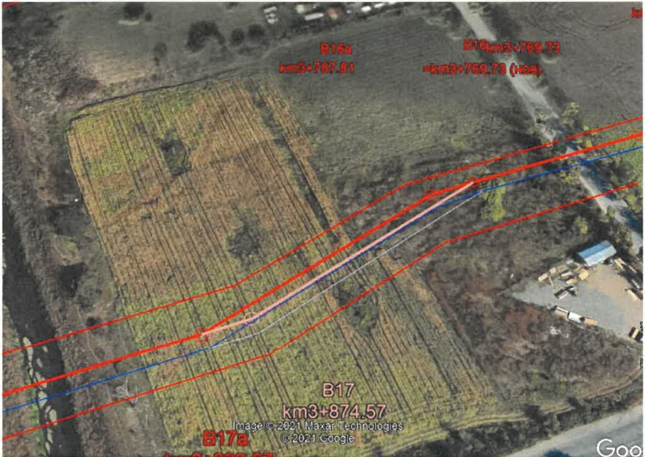
Фигура 1 - Визуализация на изменение по буква "в-1" в рамките на сервитута върху подложка от Google Earth

Няма промяна в засегнатата територия от сервитута на ПУП – окончателен проект, одобрен със заповед № РД-02-15-156/13.11.2015 г. на МРРБ.